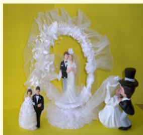
Links 6,- €, Mitte 22,- €, Rechts 14,- €