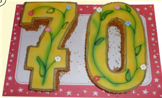
„Cremetorte als Zahl“

(Preis je Stück, Maß je ca. 30 cm x 20 cm)