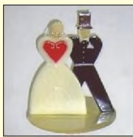
Handgefertigtes Brautpaar aus Karamell, speziell für Sie nach altem Vorbild gefertigt. Bodendurchmesser 16 cm Höhe ca. 23 cm