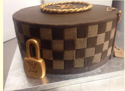
LVT Torte (alles essbar!)