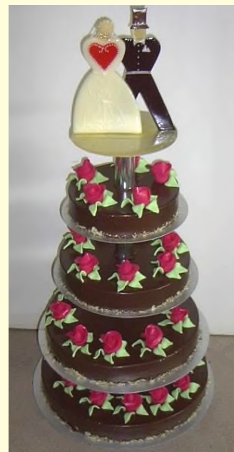
(Etage 3,4,5,6 Preis ohne Brautpaar ca. 350,- €)