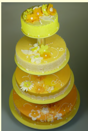
(Etage 2+3+4+5, ca. 260,- €)