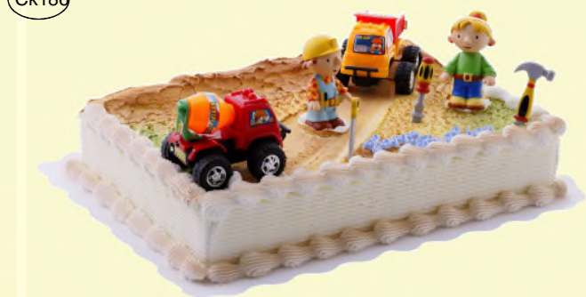
„Bob der Baumeister“