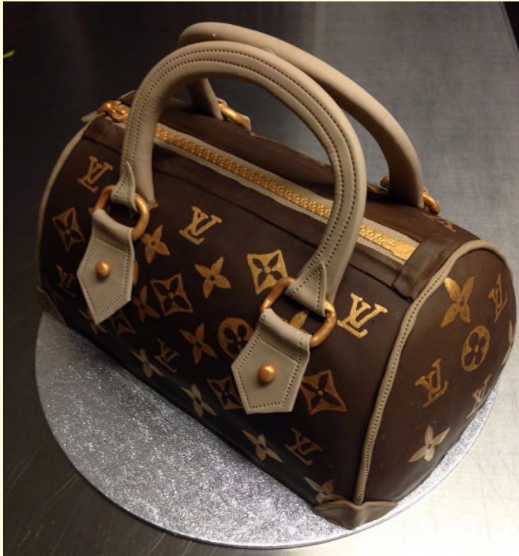
LVT Handtasche (alles essbar!)

Jede einzelne Torte ist ein Designerstück. Die Verwirklichung Ihrer Torten-Träume erfordert einen gewissen Zeitaufwand. Eine Vorbestellung von mindestens 14 Tagen ist daher zwingend erforderlich. Alle Preise auf Anfrage.