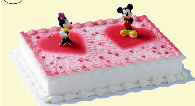
„Micky und Minni“