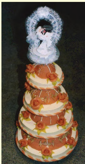
(Etage 3,4,5,6, Preis ohne Brautpaar ca. 350,00 €)

Wir unterstützen Sie mit unserer Handwerkskunst, damit dieser Moment in Highlight wird.