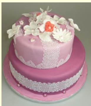
(Etage 3+4, ca. 140,- €)