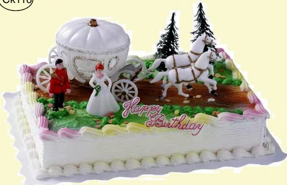
„Prinz und Prinzessin“