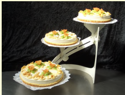
(3-stöckig, Größe Nr. 3,4,5, ca. 220,- €)