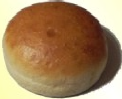
im Tray gebacken